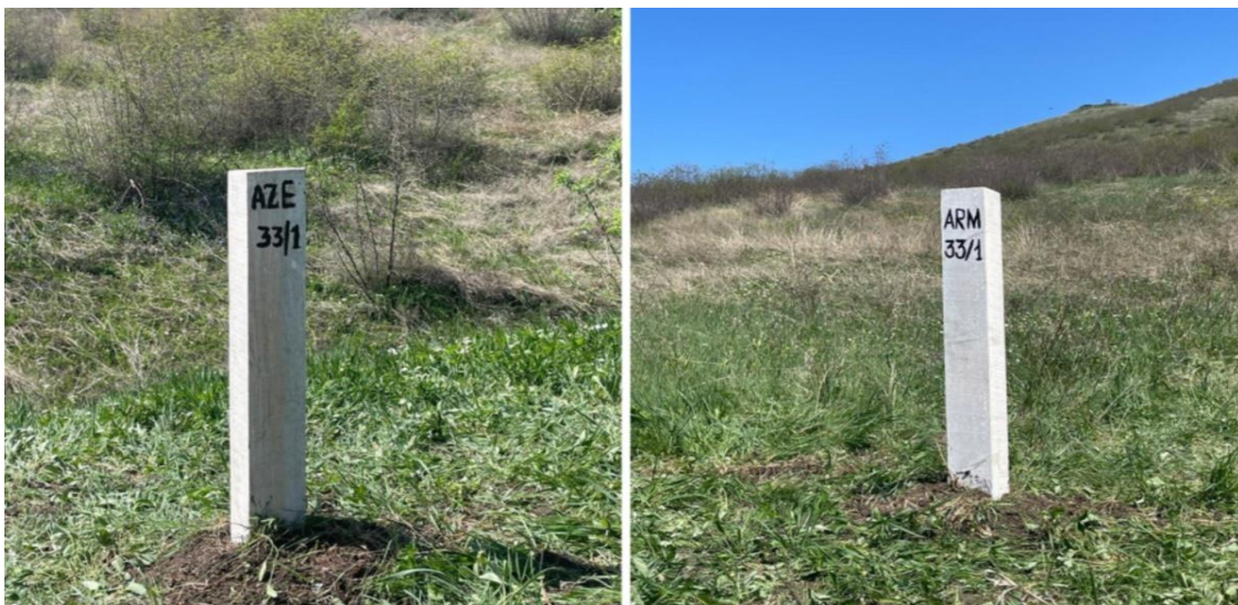
Şəkil 4. Azərbaycan-Ermənistan arasında dövlət sərhəd nişanları

Azərbaycan Respublikası ilə Ermənistan arasındakı sərhəddə koordinatların dəqiqləşdirilməsi işləri çərçivəsində aparılan geodeziya ölçmələri əsasında 2024-cü ilin may ayında artıq 40 sərhəd dirəyi quraşdırıldı (Şəkil 4).