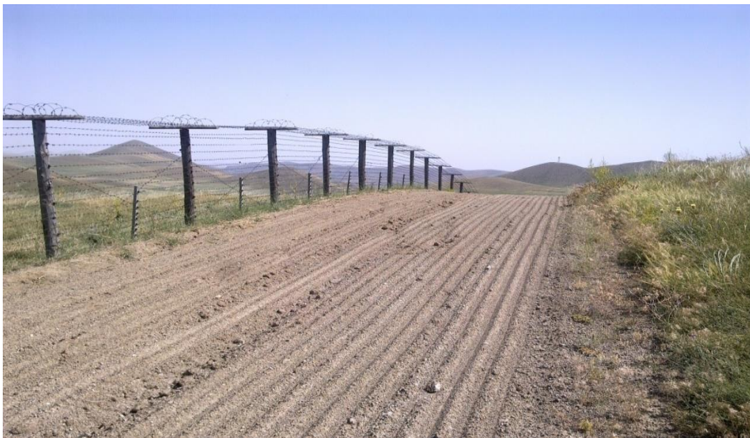
Şəkil 2. Dövlət sərhəd xətti