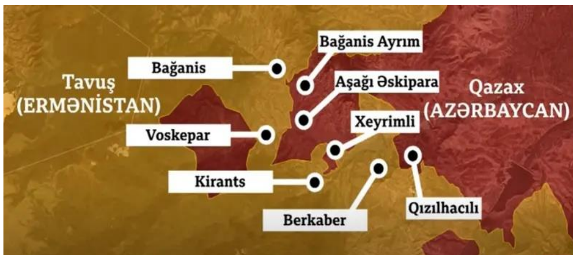
Şəkil 3. Qazax rayonunda delimitasiya olunmuş sərhəd kəndləri

Tərəflər arasında sərhədlərin delimitasiya və demarkasiya prosesinin müəyyənləşdirilməsi ilk olaraq şimal bölgəsindən başladı. Delimitasiya prosesinin ilkin mərhələsində tərəflər sərhəd xəttinin ayrı-ayrı hissələrinin keçmiş Sovet İttifaqı dövründə mövcud olan hüquqi cəhətdən əsaslandırılmış respublikalararası sərhədə uyğun olaraq, Qazax rayonunun 4 kəndindən: Bağanis Ayrım, Aşağı Əskipara, Xeyrimli, Qızılhacılı, Kirants, Voskepar, Berkaber (Şəkil 3).