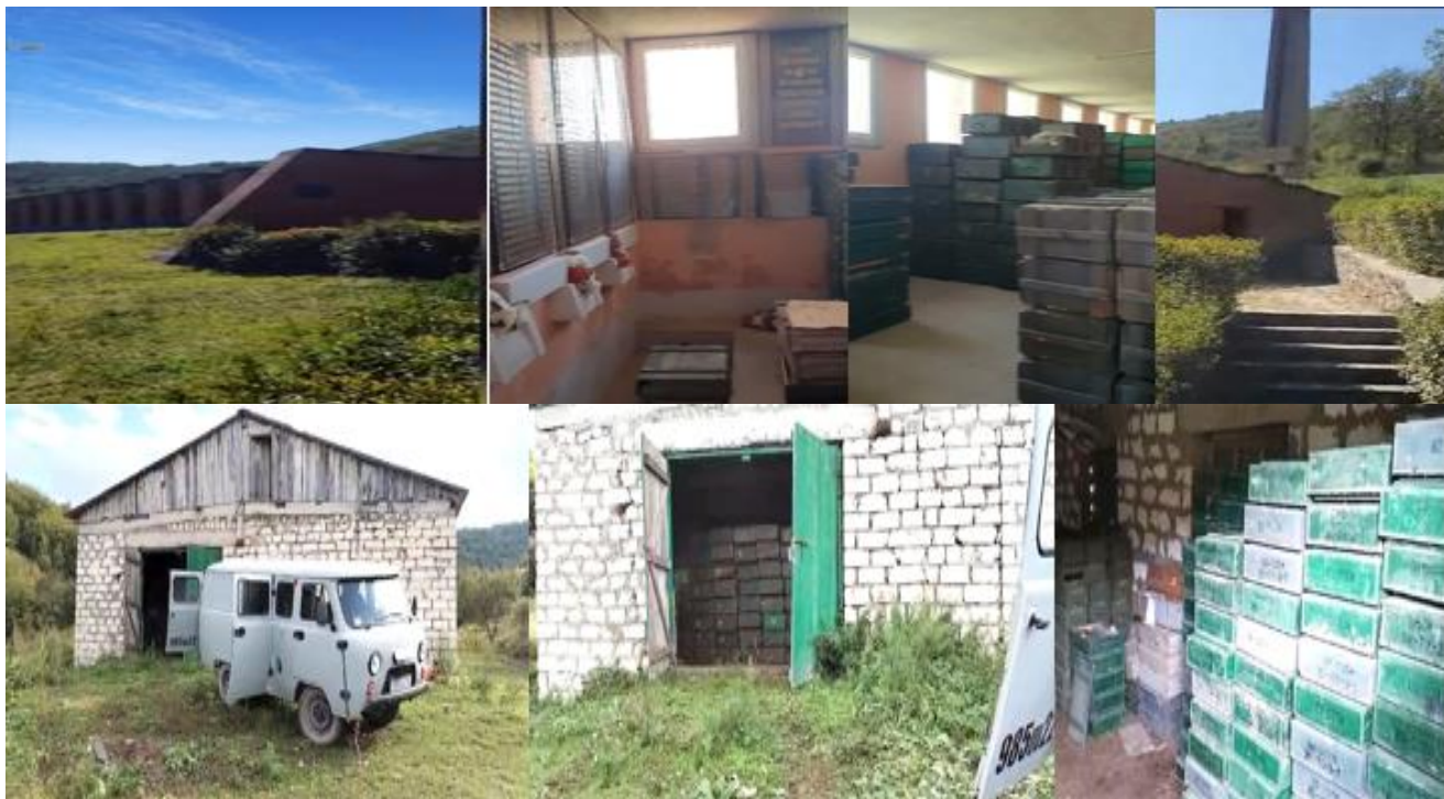
Şəkil 2. Xocavənd rayonunda memorial kompleksdə və Kəlbəcər rayonu ərazisində fermada aşkar edilən silah və sursat

həyat təzi təmin olunduqca bunu yaxından dərk edəcəklər. Xankəndində Əmək və Əhalinin Sosial Müdafiəsi Nazirliyi tərəfindən erməni əsilli vətəndaşlar üçün artıq bütün şərait yaradılmışdır [5]. Lakin hələ də silahı yerə qoymayan və Qarabağın ərazisində gizlənən silahlı qruplar vardır. Qarabağ ərazisinin çətin relyefini, dağlıq və meşəlik olmasını nəzərə alsaq, deyə bilərik ki, gizlənmiş terrorçuları zərərsizləşdirmək vaxt alacaq. Bugün Azərbaycanı daxildən təhdid edən təhlükə yoxdur.